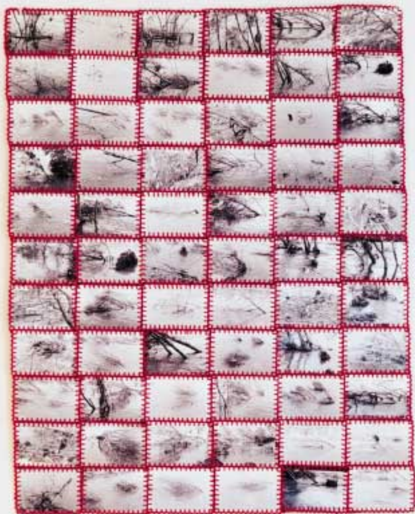
S/T Fotografías, tela, hilo (94 x 118) cm 2000