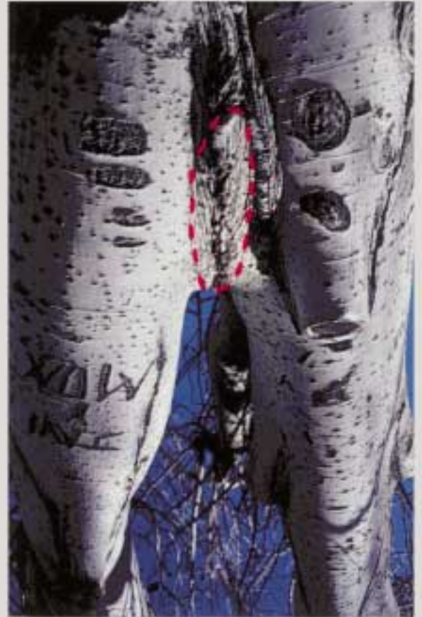
S/T Fotografía, lana, aluminio. 41 x 52 cm. 2000-1