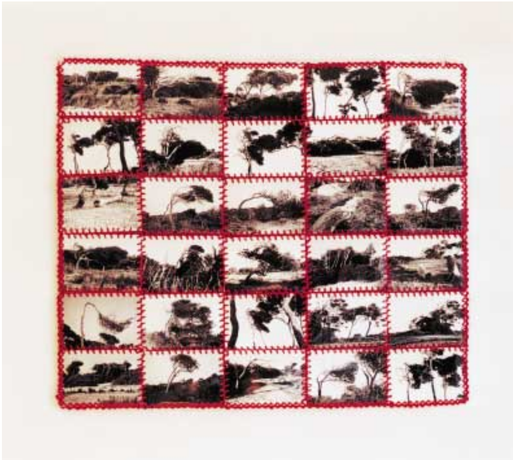
S/T (Y SIN EMBARGO) Fotografías, tela, hilo (63 x75) cm. 2000