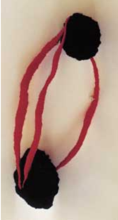
S/T Lana, alambre, tela 2000