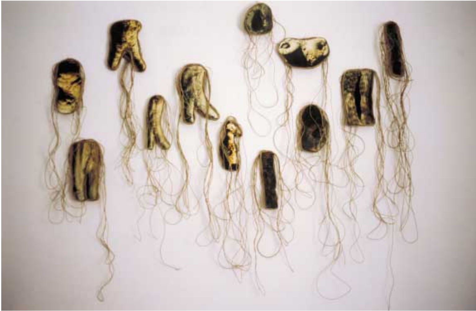
SAVIA Fotografías, corcho, cuerdas 1999